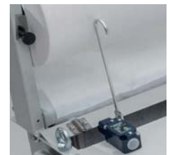
Vliesmangelschalter Fleece limit switch