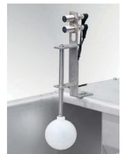
Schwimmerschalter Float switch