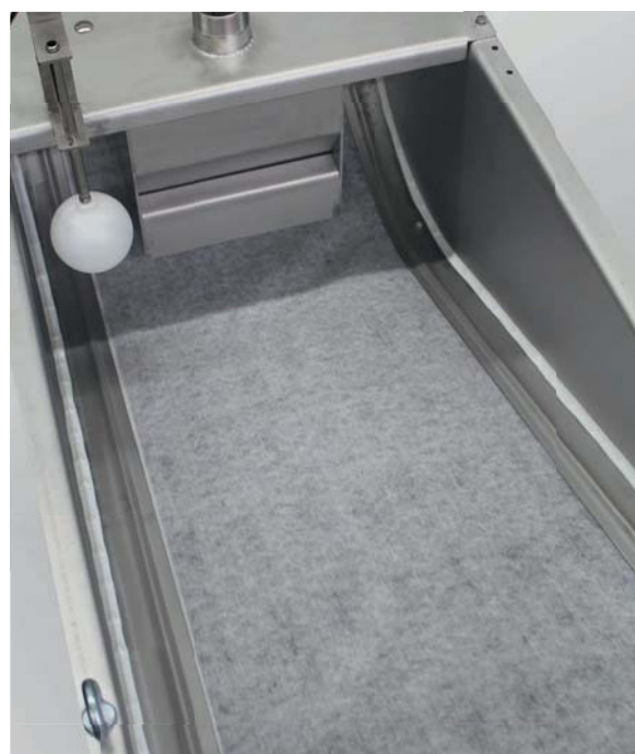
Filtermulde / Filter trough

Information und weitere Maße: Information and more dimensions: www.polo-filter.com/Produkte-Bandfilter-Schwerkraftfilter-SB.html