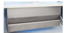
Einlaufverteiler Inlet distributor