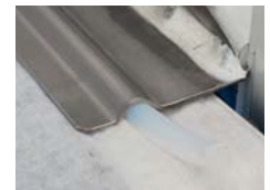
Dichtung seitlich Lateral seal